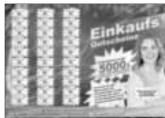
Flyer des Gewerbeverbands Wemding

Bei der großen Wertmarkenaktion 2020 des Gewerbeverband Wemdings wurden insgesamt 100 Einkaufsgutscheine verlost. Kürzlich wurden die glücklichen Gewinner gezogen. Alle weiteren glücklichen Gewinner sind unter www.wemding.de einzusehen oder sind auf den Gewinnerlisten in teilnehmenden Geschäften ausgehängt.